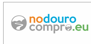
A Cores Positivo / Negativo

Pantone 7539 C R> 158 G> 158 B> 158 C> 41 M> 33 Y> 34 K> 1