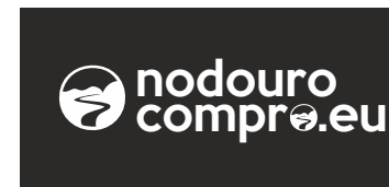
Alto contraste Positivo / Negativo